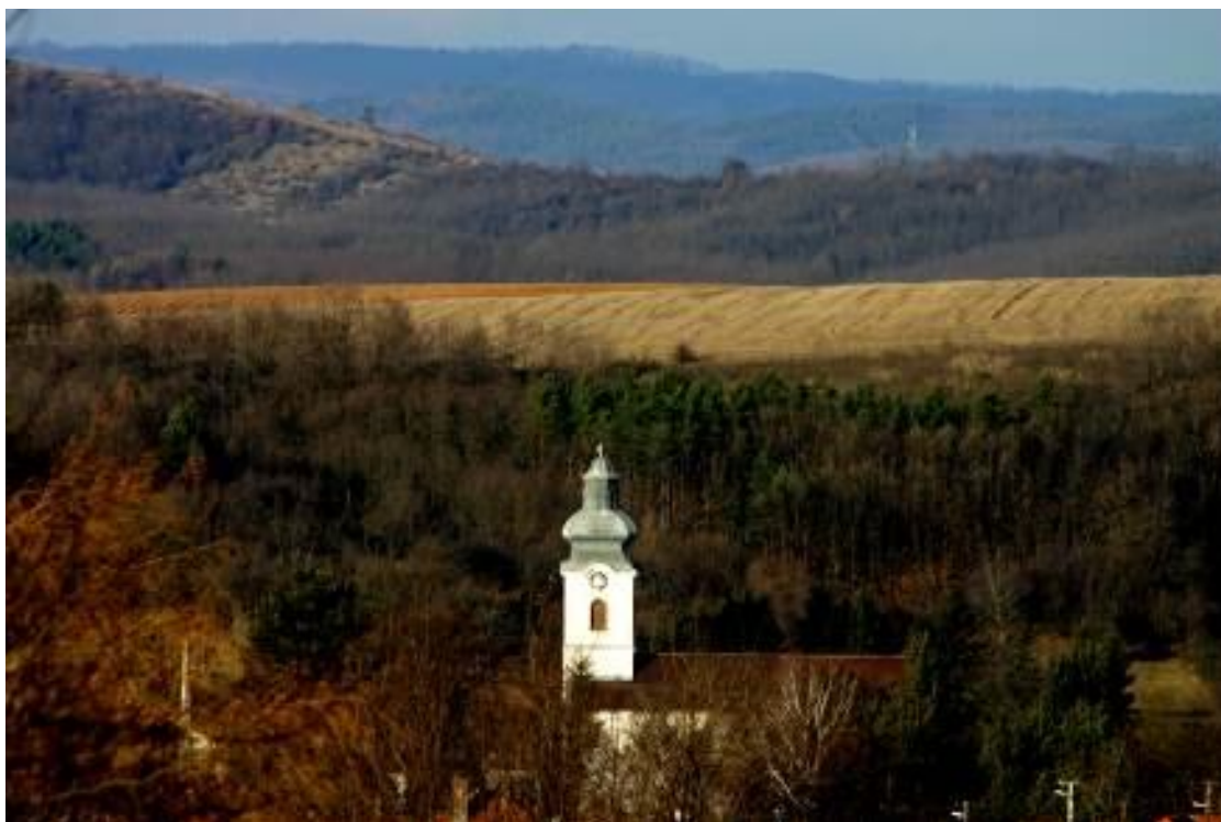
Bodony település erdővel övezve

Szerinted milyen jövője lehet Bodonynak?