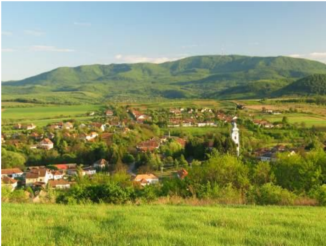
Bodony a Kopasz hegyről 2007-ben

A TSZ megszűnése után néhány magángazda műveli csak a földeket. S a mostani szárazság pedig még a kis kerteket megművelőknek sem kedvez, nem terem annyi sem, hogy a saját