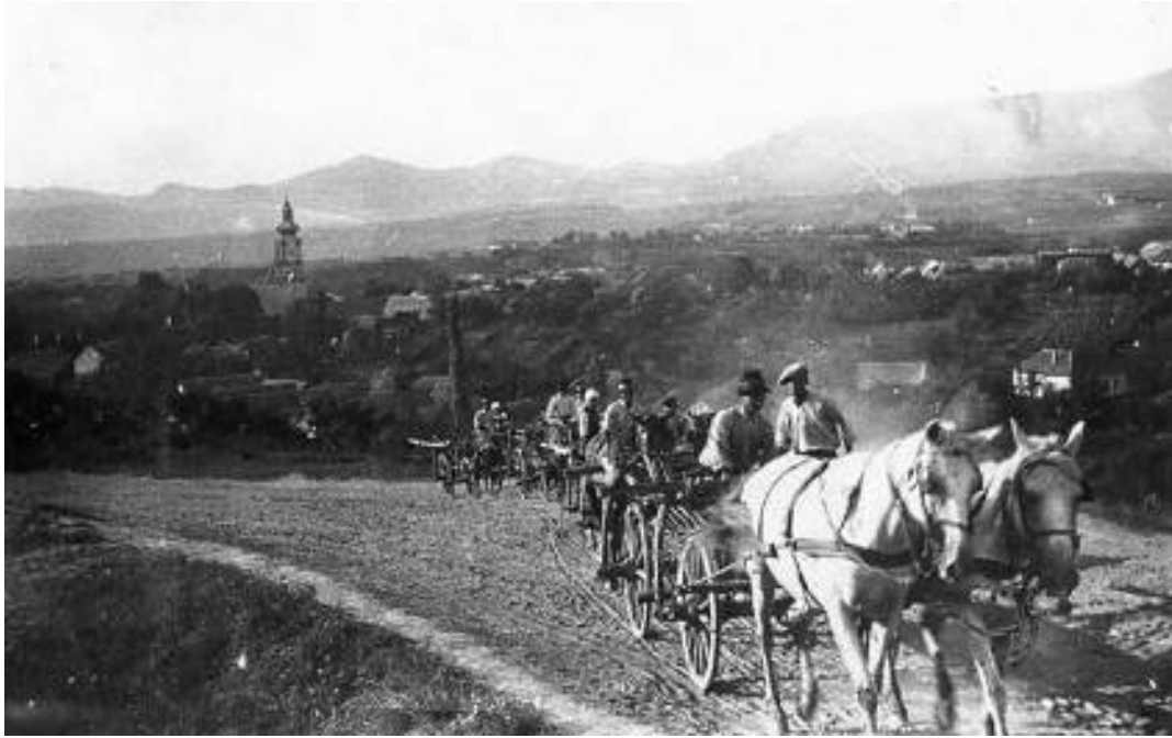
A falu és a templom a Mátra ölelésében, a Kopasz hegyről nézve, lovas kocsikkal munkába menet (1930-40-es évek)