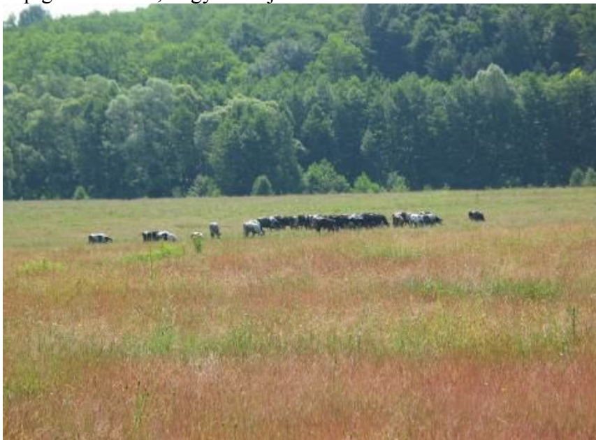
A Lányasi legelő

Tagja vagyok a szomszéd Vadásztársaságnak is Parádon. S mikor úgy döntöttem, hogy valahol veszek egy házat a környéken, a választásom Bodonyra esett. Nagyon tetszett a környék, a barátságos emberek. Másmilyenek az itteniek, mint parádóhutaiak, ők ridegebbek. Kötődöm a településhez, a jó ismerősökhöz. Főként a vadászokhoz, de kialakultak nagyon szoros kapcsolatok is a faluban élőkkel, pl. a szomszédokkal, vagy idős barátainkkal, akik segítenek rendben tartani a portát, ha nem vagyok itt, de én is segítek nekik, amiben tudok. Emlékszem, amikor füvesítettem, s épp vettem a fűmagot, jött egy ember az utcán, a mai napig sem tudom, hogyan hívják.